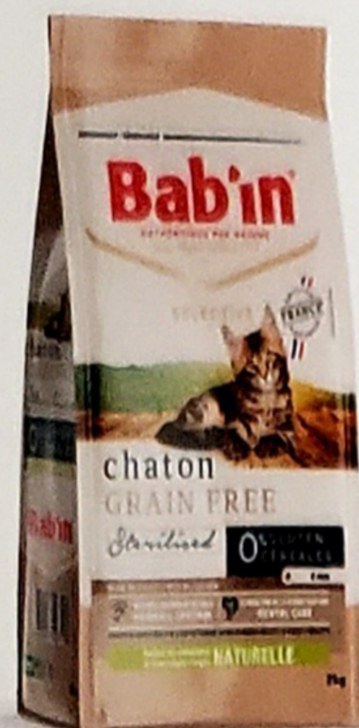
Sacs de 2 & 8KG

Riche en poulet est formulé sans céréales ni gluten pour répondre aux besoins des chatons sensibles aux céréales et au gluten. Son taux élevé de protéines d'origines animales de hautes qualités 83% (Poulet, œuf, truite) combiné à des sources alternatives de glucides en font un aliment hautement digestible. Il contient une sélection de plantes, de levure de bière et graines riches en acides gras essentiels favorisant la bonne santé de la peau et du pelage. Cet aliment favorise l'élimination des plaques dentaires et réduira la formation des boules de poils grâce à son action Hairball control. Convient au chat non stérilisé et stérilisé.