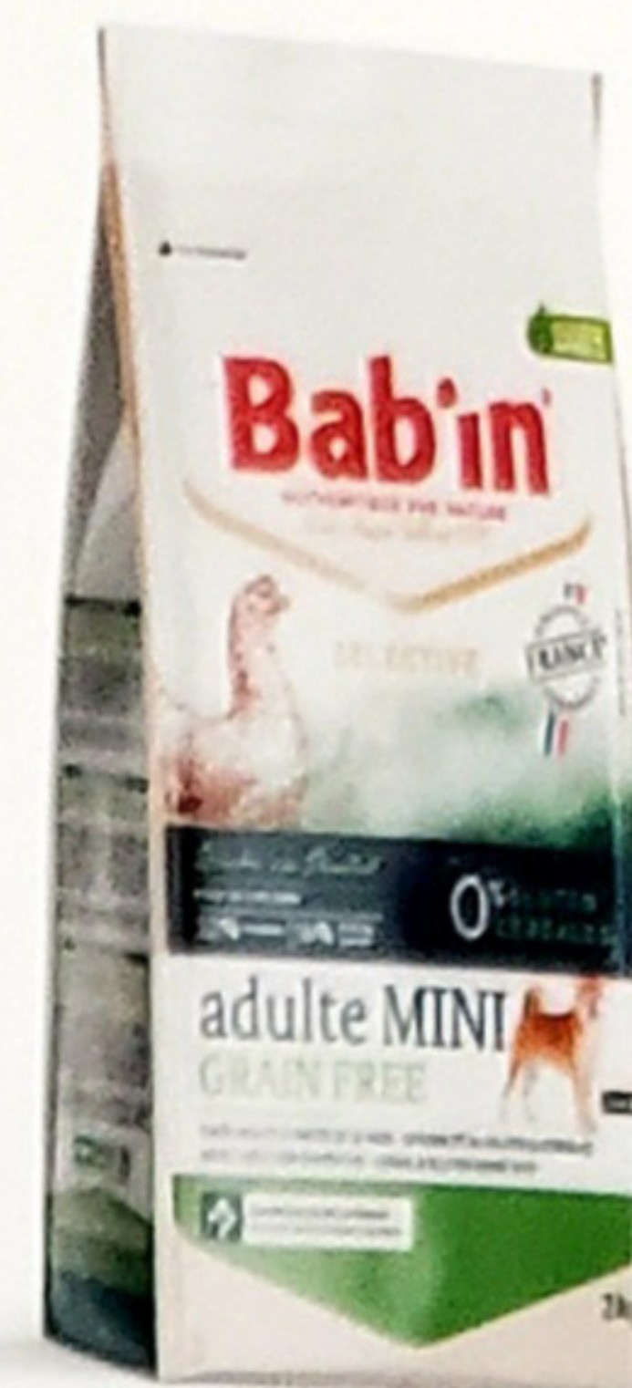
Sac de 3KG

Riche en poulet, est formulé sans céréales ni gluten pour répondre aux besoins des chiens adultes sensibles aux céréales et au gluten. Son taux élevé de protéines d'origines animales de hautes qualités 75% (Poulet, truite) combiné à des sources alternatives de glucides (pomme de terre, pois chiche, lentille blonde, pois jaune) en font un aliment hautement digestible. Il contient une sélection de plantes, de levure de bière et graines riches en acides gras essentiels favorisant la bonne santé de la peau et du pelage. Il apporte également un soutien articulaire (Glucosamine, Chondroïtine).