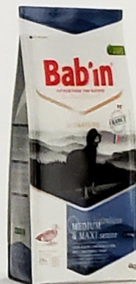
Sacs de 4 & 15KG