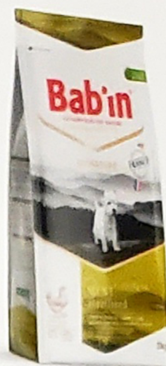
Sacs de 3 & 8KG