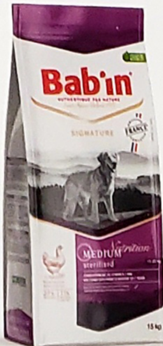
Sacs de 4 & 15KG

> Apport en fibre et L-carnitine augmenté.