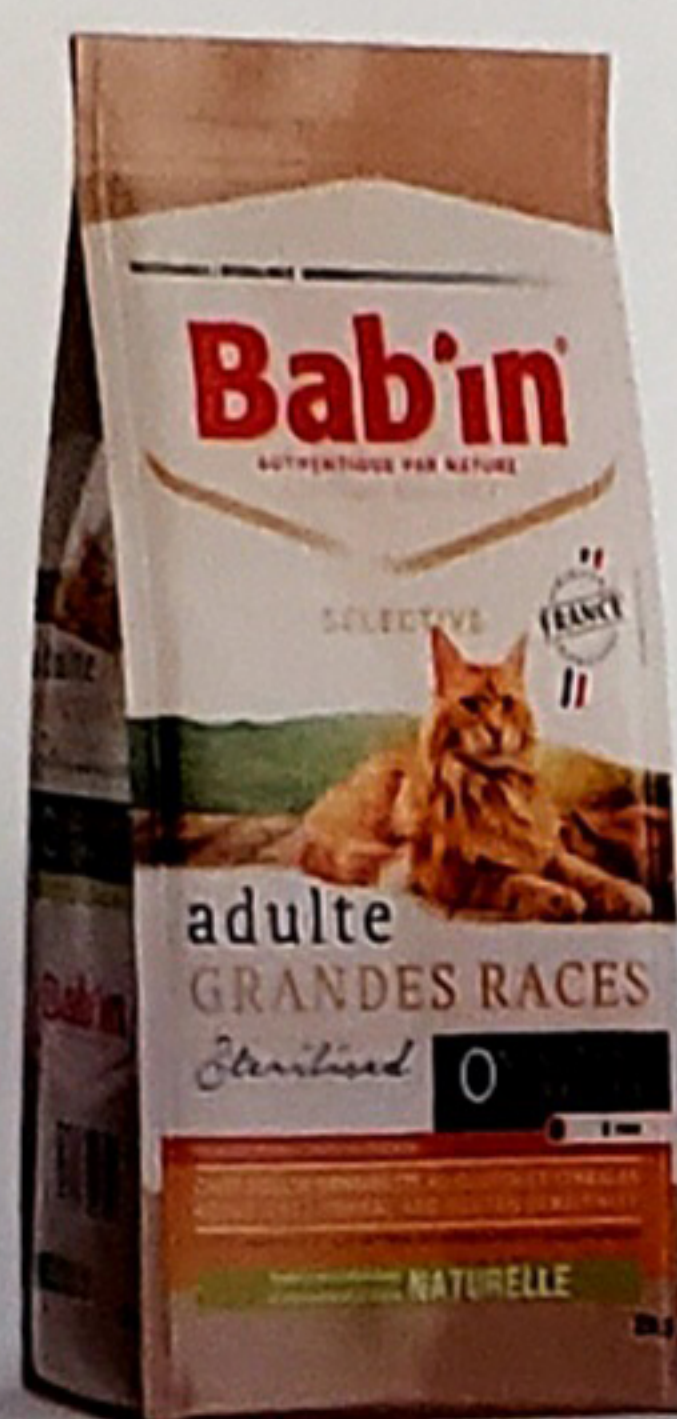
Sacs de 2 & 8KG

Riche en poulet est formulé sans céréales ni gluten pour répondre aux besoins des chats adultes sensibles aux céréales et au gluten. Son taux élevé de protéines d'origines animales de hautes qualités 83% (Poulet, œuf, truite) combiné à des sources alternatives de glucides en font un aliment hautement digestible. Un aliment de taille adaptée et un complexe articulaire répondront aux attentes des grands chats. Contient une sélection de plantes, de levure de bière et graines riches en acides gras essentiels favorisant la bonne santé de la peau et du pelage. Cet aliment favorise l'élimination des plaques dentaires et réduira la formation des boules de poils grâce à son action Hairball control. Convient au chat non stérilisé et stérilisé.