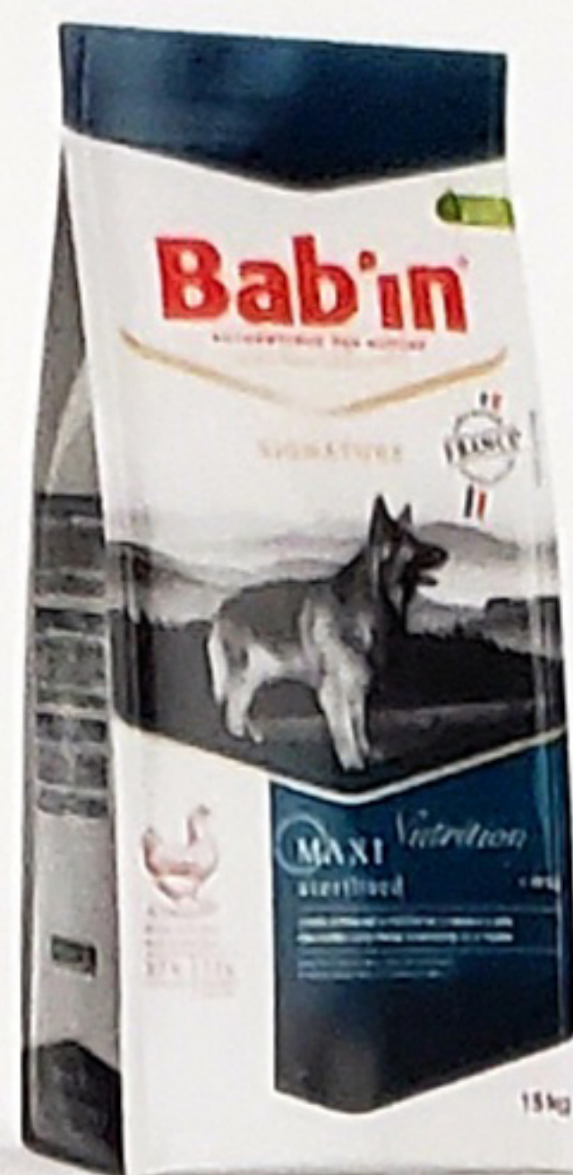
Sac de 15KG

Protéines de volaille déshydratées 30% (poulet), maïs, blé, graisse de canard, pulpe de betterave, levure de bière, chlorure de sodium, glucosamine (origine marine), sulfate de chondroïtine, extraits de plantes riches en saponines (quillaja saponaria, quinoa, camelia, yucca).