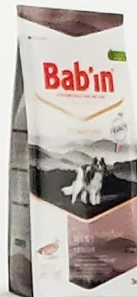
Sac de 3KG