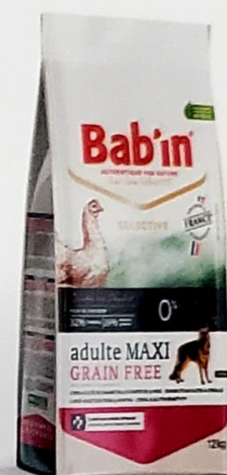
Sac de 12KG

Riche en poulet, est formulé sans céréales ni gluten pour répondre aux besoins des chiens adultes sensibles aux céréales et au gluten. Son taux élevé de protéines d'origines animales de hautes qualités 75% (Poulet, truite) combiné à des sources alternatives de glucides (pomme de terre, pois chiche, lentille blonde, pois jaune) en font un aliment hautement digestible. Il contient une sélection de plantes, de levure de bière et graines riches en acides gras essentiels favorisant la bonne santé de la peau et du pelage. Il apporte également un soutien articulaire (Glucosamine, Chondroïtine).